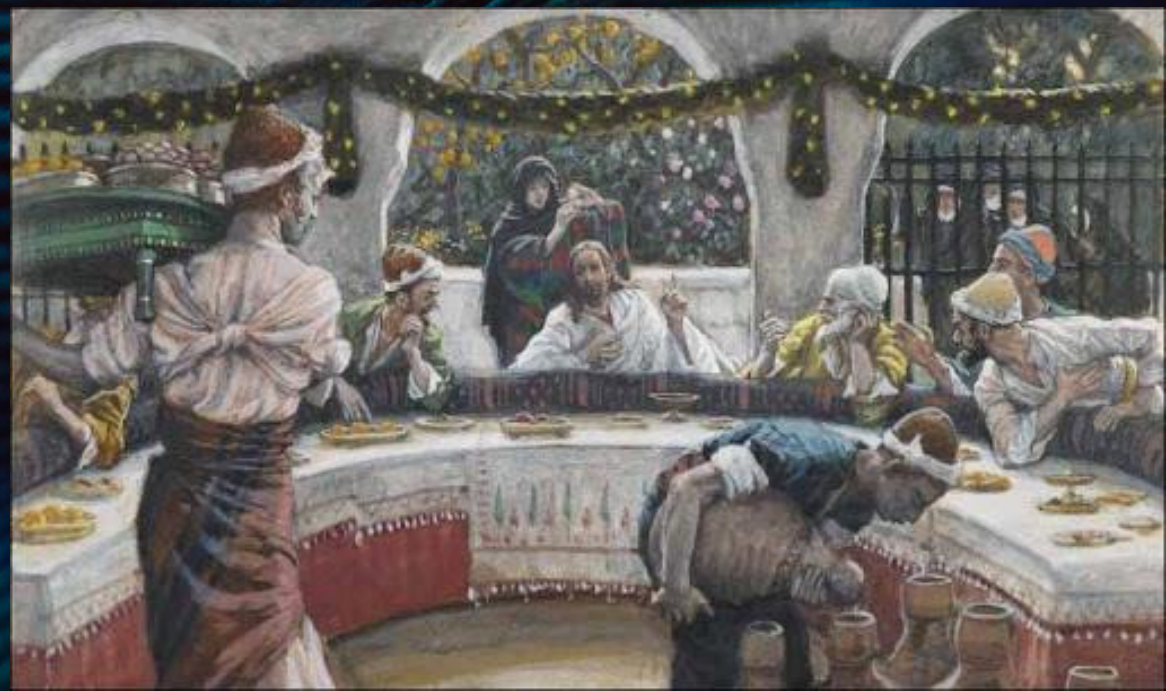
Hostina u farizea, James Tissot (1836-1902)

Takové Bůh odmění tím, že je sám obslouží. To je ta největší pocta pro služebníky, že je Pán sám obslouží.