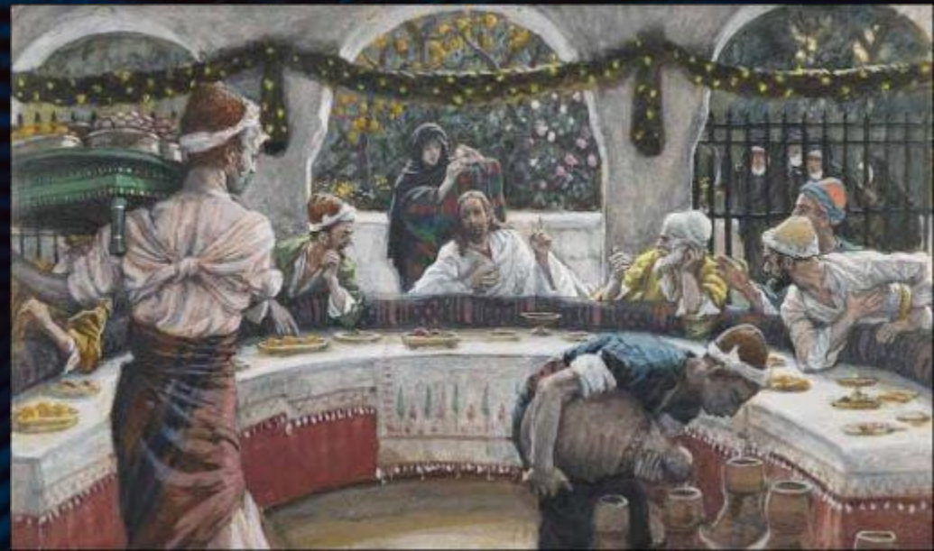
Hostina u farizea, James Tissot (1836-1902)

Matouš 18:11 Vždyť Syn člověka přišel zachránit, co zahynulo.