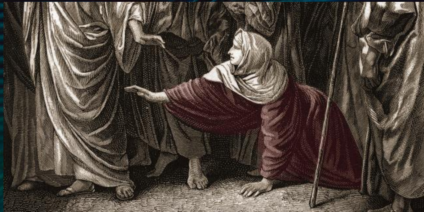
Žena s krvetokem, biblická ilustrace

On musela žít izolaci od ostatních lidí, trpěla samotou, vynaložila všechny peníze na léčení a nic nepomohlo, dokonce i léčení její stav zhoršil.